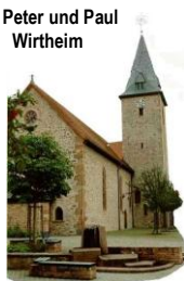
St. Peter und Paul Wirtheim