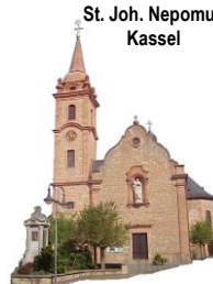
St. Joh. Nepomuk Kassel