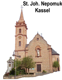
St. Joh. Nepomuk Kassel